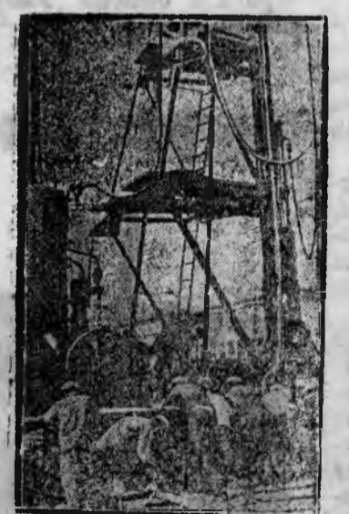
В Москве на метрострое приступили к сооружению станции „Гаврикова улица“

На снимке: Перестановка металлического копра.