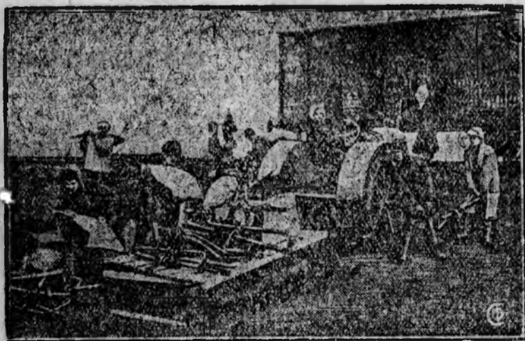
На снимке: Ввод организованная на хуторе „Новые Рогачки“ выгружает на станцию полученный прицепной тракторный инвентарь.

Страна должна и будет иметь 1700 новых МТС